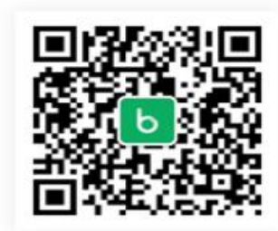
步道乐跑微信公众号

直接扫描下载，关注“步道乐跑”微信公众号 苹果 APP Store 各大安卓市场直接搜索“步道乐跑”